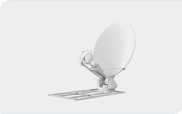
محطة SNG ثابتة