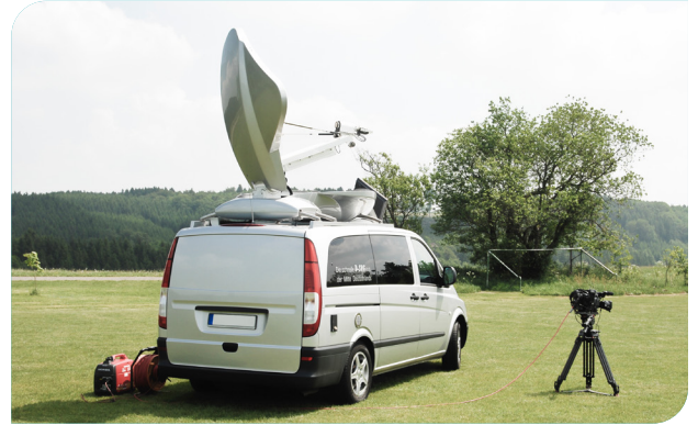
محطة SNG متنقلة